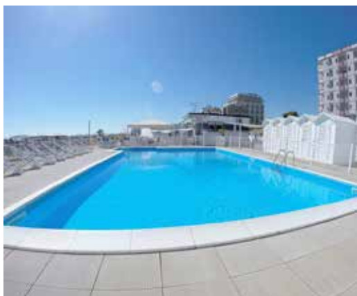
Piscina a pagamento presso la spiaggia convenzionata (N. 122)

ALTRI SERVIZI: parcheggio privato a pagamento, biciclette ad uso gratuito, spiaggia convenzionata con piscina (ingresso a pagamento), serate a tema, momenti di svago.