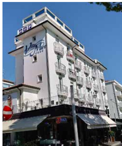
PANORAMICA PISCINA/SOLARIUM SUL TETTO